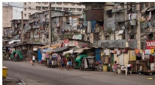
รูปภาพที่ ๒

๑. นักเรียนดูรูปภาพที่ครูดัดบนกระดานดำ ๒ รูปภาพ จากนั้นนักเรียนและครูสนทนาในประเด็นต่อไปนี้