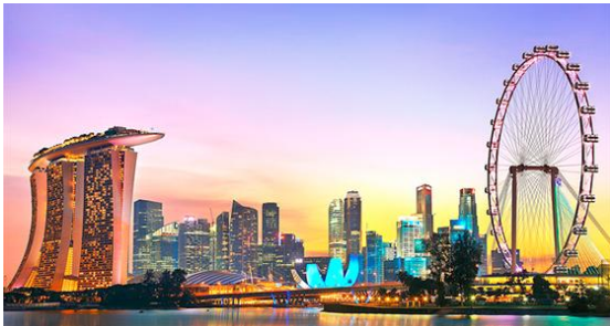
รูปภาพที่ ๑