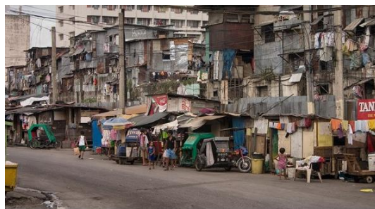
รูปภาพที่ ๑ รูปภาพที่ ๒

๑. นักเรียนดูรูปภาพที่ครูติดบนกระดานดำ ๒ รูปภาพ จากนั้นนักเรียนและครูสนทนาในประเด็นต่อไปนี้